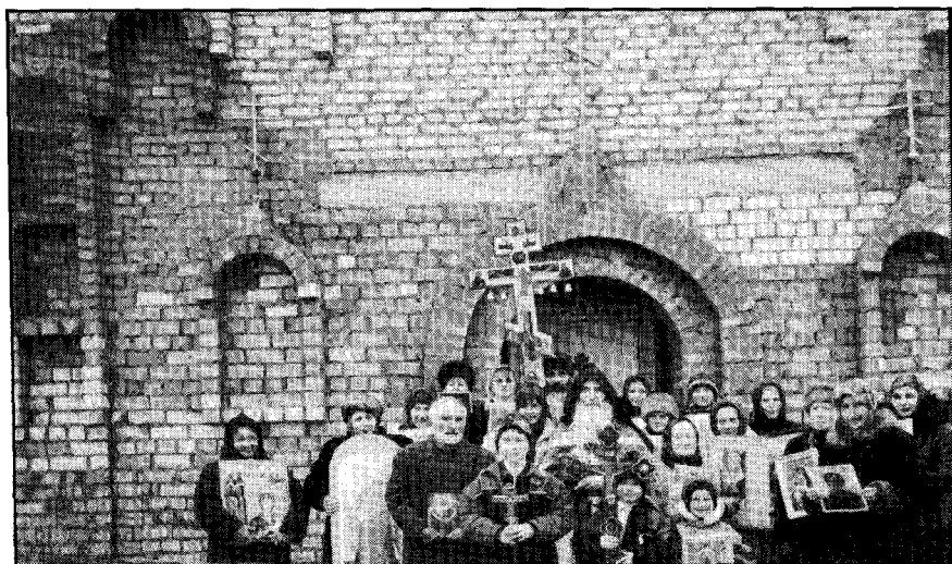
Ὁ π. Μιχαὴλ μετὰ τοῦ ποιμνίου του ἐξωθι τοῦ Ἱ. Ν. Ἀγίας Σκέπης εἰς Λευκορωσίαν.