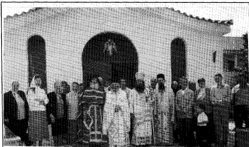
Μετά την θείαν λειτουργίαν εἰς τιμὴν καὶ μνήμην τοῦ ἁγίου πατρὸς Ματθαίου εἰς Ἱ. Ν. Ἀγίας Αἰκατερίνης εἰς Κορωπὶ Ἀττικῆς. Διακρίνονται ὁ Σεβ. Κήρυκος, ὁ Πρωτοπρ. π. Θωμᾶς, ὁ ἱερεὺς π. Ἀνδρέας καὶ ὁ π. Μιχαὴλ ἀπὸ Λευκορωσία ἐν μέσῳ τῶν εὐλαβῶν προσκυνητῶν.