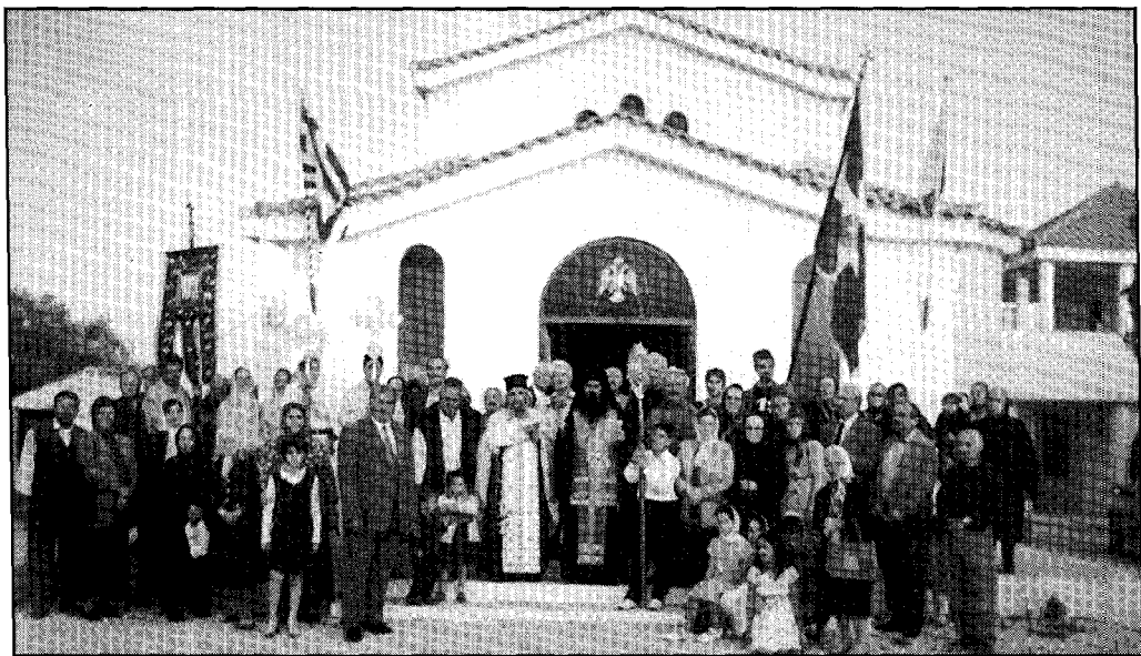
Στιγμιότυπα από την έσπερινήν εκδήλωσιν της Ὑψώσεως τοῦ Τιμίου Σταυροῦ εἰς τό Μητροπολιτικόν Ἱδρυμα Ἁγίας Αἰκατερίνης. Ἄνω: Οἱ προσκυνηταί κάτωθεν τοῦ μεγάλου Σταυροῦ, ὅπου ἐφάλησαν οἱ χαιρετισμοί τοῦ Τ. Σταυροῦ. Κάτω: Ἐξῶδι τοῦ Ἱ. Ν. Ἁγίας Αἰκατερίνης.