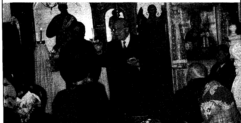
Κυριακή τῆς Ὁρθοδοξίας 2004 εἰς Ἱ. Ν. Ἀγ. Δημητρίου Ἀχαρνῶν.